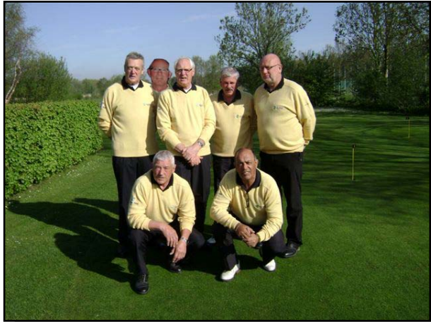
Heren senioren 1 .... Kampioen!